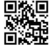
Lageplan (QR-Code scannen)

Nachlese Submission: Dienstag, 14. Februar 2023 – 12.30 Uhr Holzlagerplatz bei Reith